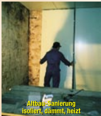
Altbau-Sanierung isoliert, dämmt, heizt

ISO THERM PLUS Die neue Fertigausbauplatte gibt sanfte Flächenwärme bei geringem Stromverbrauch. So belegte Wände, Mauern, Böden heizen flink behaglich warm. Begehbar, robust und wasserdicht. Energiespar-Regelung der Fertigoberfläche von 10° Frostschutz-Schimmelschutz bis zu 30° Infrarot-Wärme im Sanitär- und Wohnbereich. ISO THERM PASTNER A-3500 KREMS/Ausfahrt OST