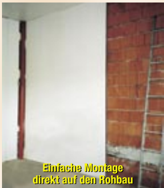
Einfache Montage direkt auf den Rohbau

Komfortabel einfach! Einschalten und jederzeit sofort warm, ohne einzuheizen, ohne eine teure Heizanlage betreiben zu müssen. Sie verwenden niederenergetischen Strom aus Wasserkraft und Wind – umweltbewusst! Die ideale Möglichkeit zur Altbausanierung und für den Um- und Neubau auf Niederenergie!